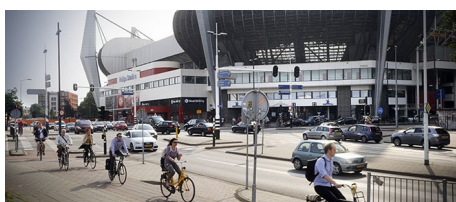
Onze business lines